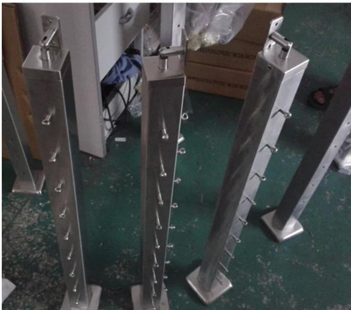
3. z szyną ze stali nierdzewnej i drewnianą górną poręcz