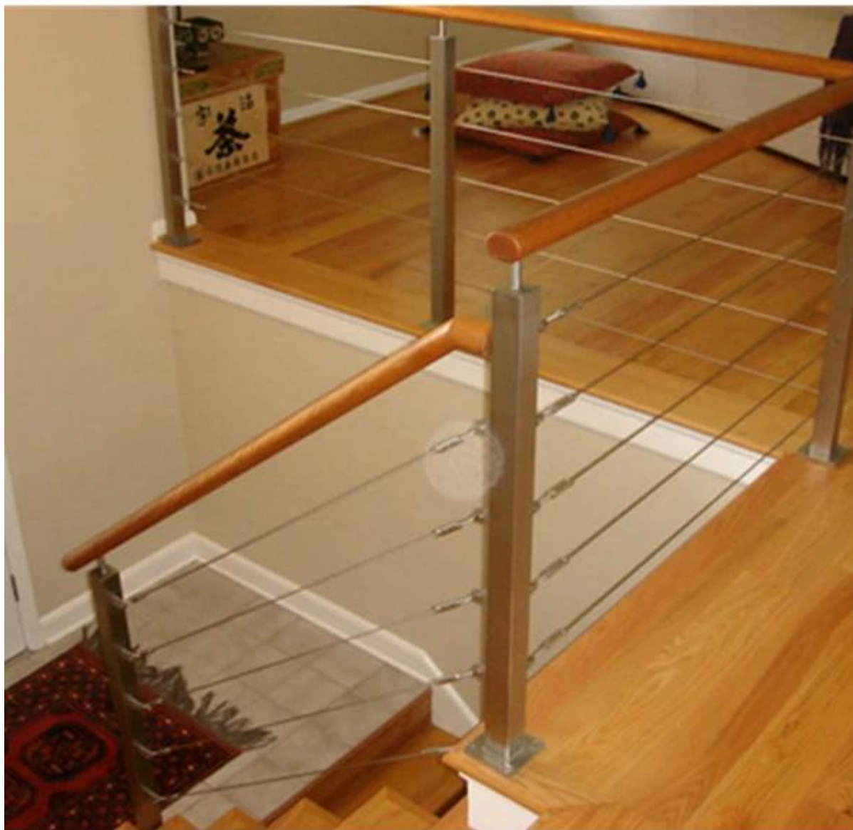
4. stosować do schodów i balkon balkon