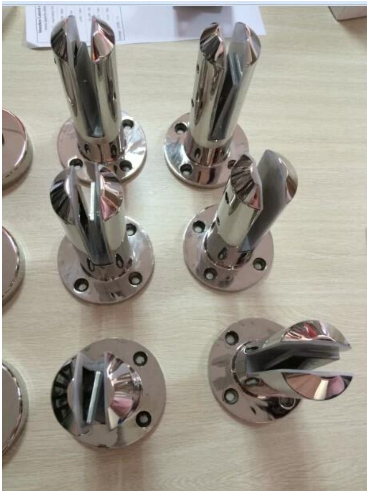
Model: SBM (kwadratowa płytka bazowa)