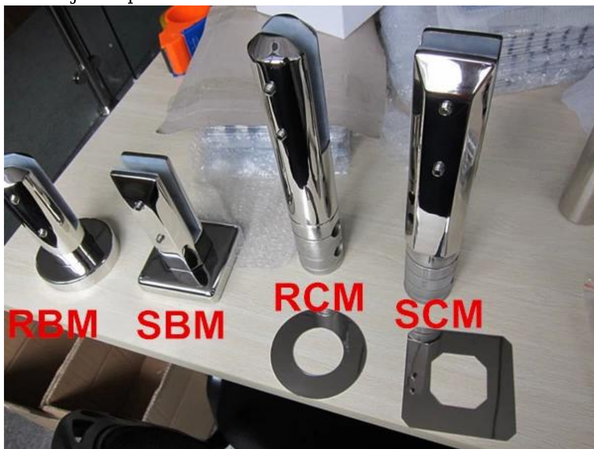
Zdjęcia projektów dla odniesienia:

1. Stal nierdzewna Czop na balkon szklane balustrady projektu: