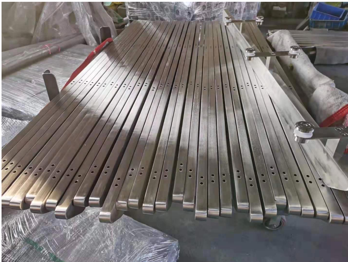
Inne projekty słupków balustrady stali nierdzewnej: