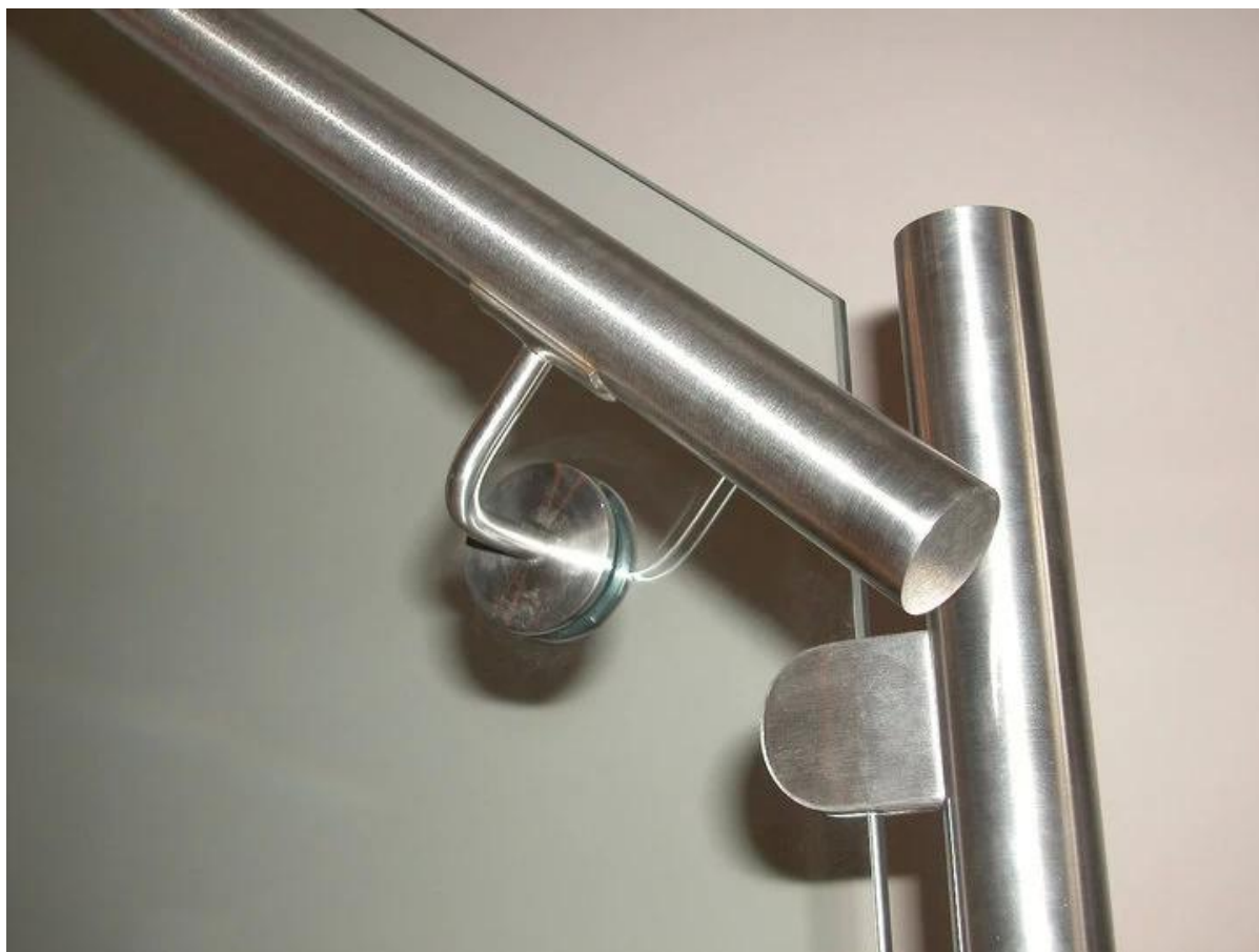
Uchwyty poręczy do użytku na zewnątrz