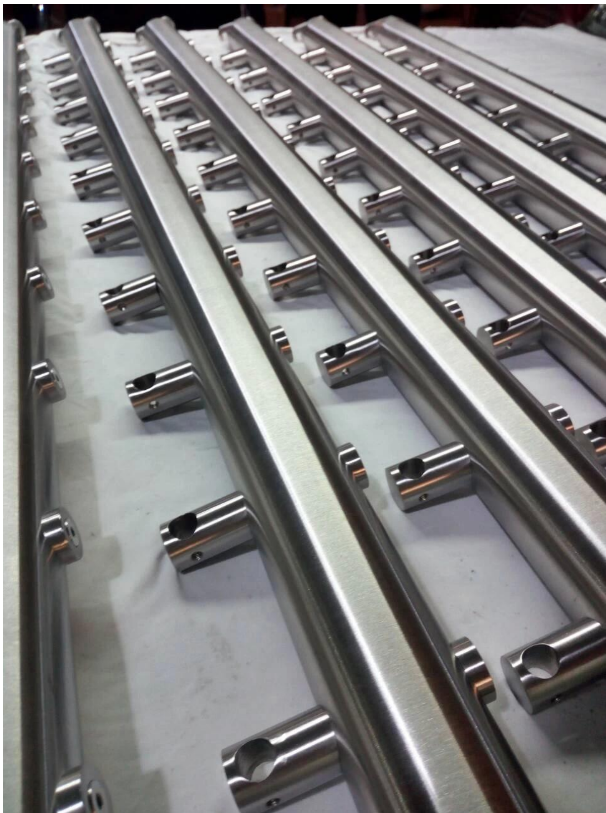
Barierki poprzeczne dla projektów schodów wewnętrznych