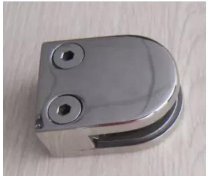
Zacisk z czarnego szkła 180 stopni BC-8035