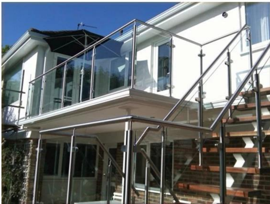
kwadratowe typu postów, typu płyta podstawy