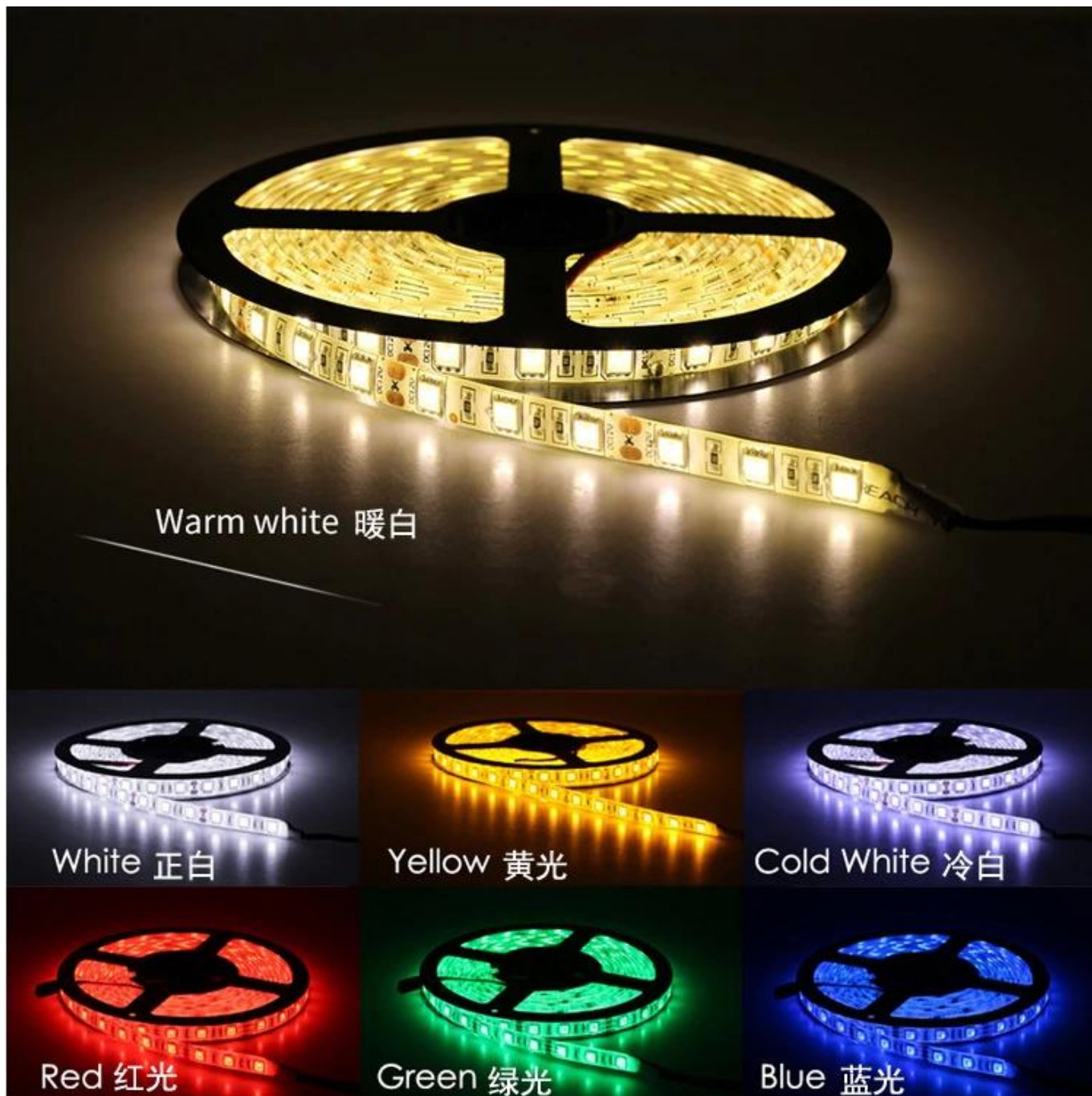
Warm white 暖白