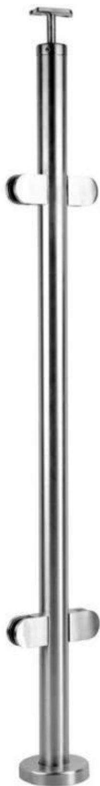
90-kierunkowy 2-kierunkowy wrzeciono LCH-108: