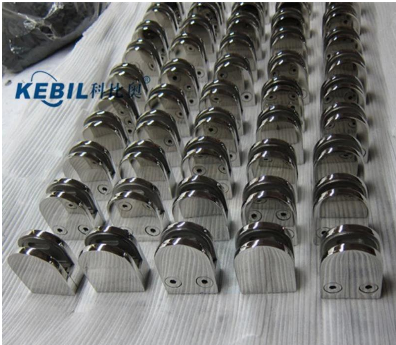
Zacisk z czarnego szkła