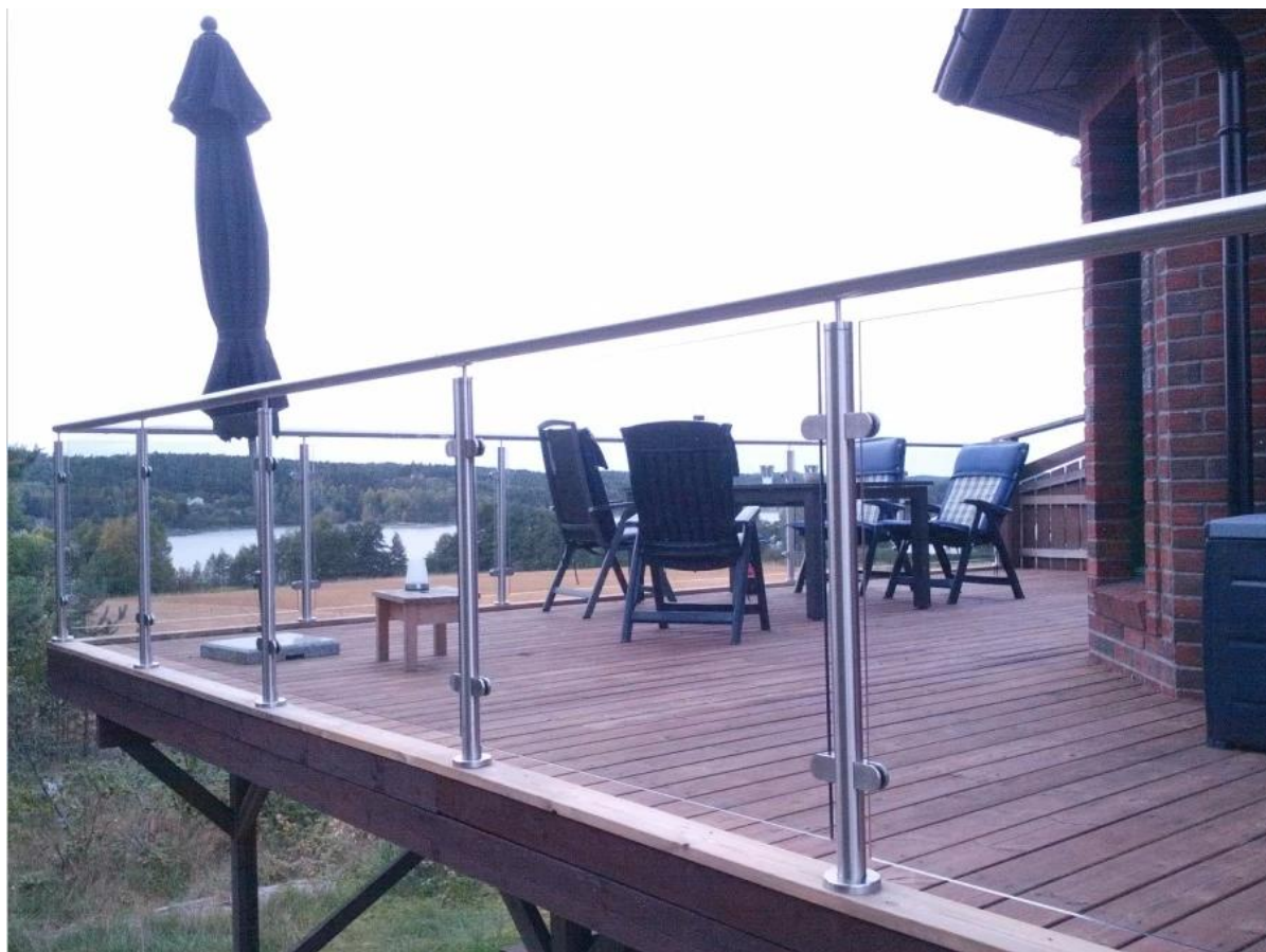
Poręcz ze stali nierdzewnej do szkła zewnętrzne schody porcelany, szkła System poręczy na balkonie