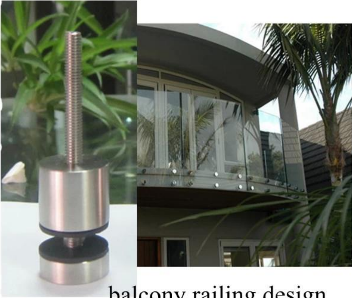
balcony railing design