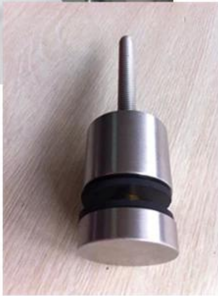
Impas na drewno