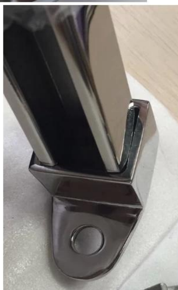
balkon balustrada szklana