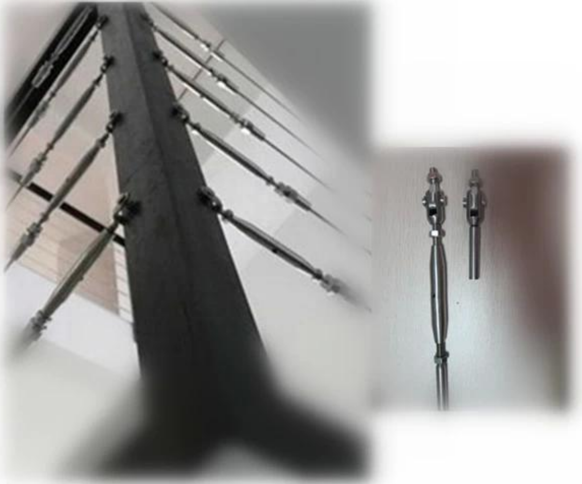
cable railing T806