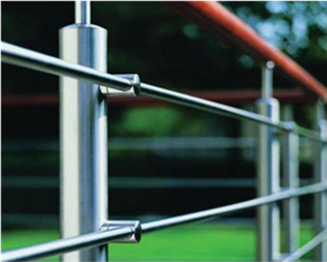
stainless steel handrail with cross bar

Chiny z kształtki szklane balustrady na balkonie i schodów, porcelana out akcesoria szklane balustrady ogrodzenia na basenie