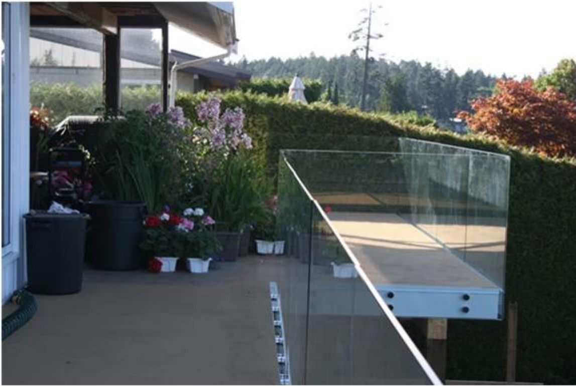
glass balustrade with standoff