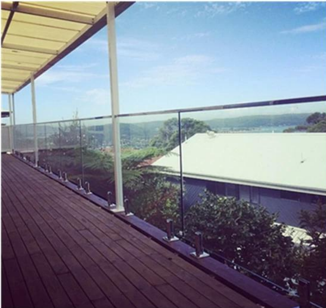
square slotted pipe

4. Inne projekty zacisku szkła Czop szklany okrągły płyta podstawy