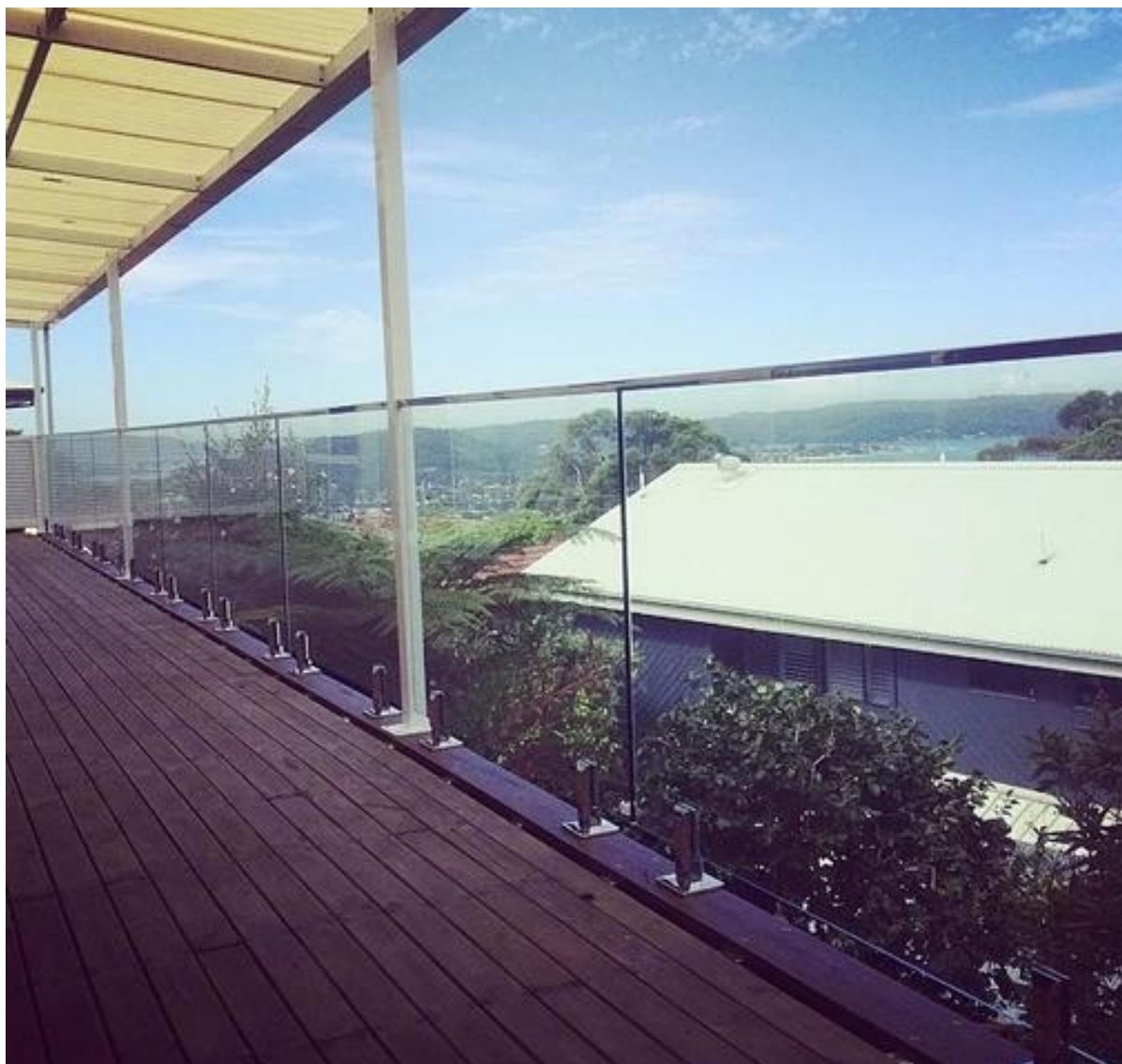
2). Balustrady ze stali nierdzewnej rura gniazdo pokład zewnątrz szkło balustrady: