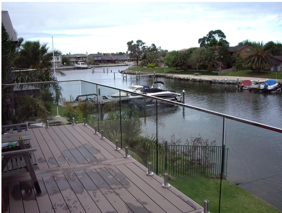
3). Balustrady ze stali nierdzewnej rura gniazdo szkło kryty balustrady: