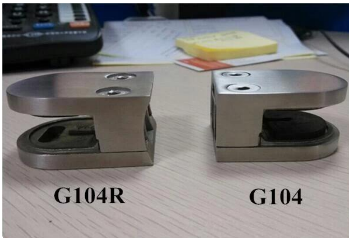
Instalacja ze stali nierdzewnej Uchwyt szkła: