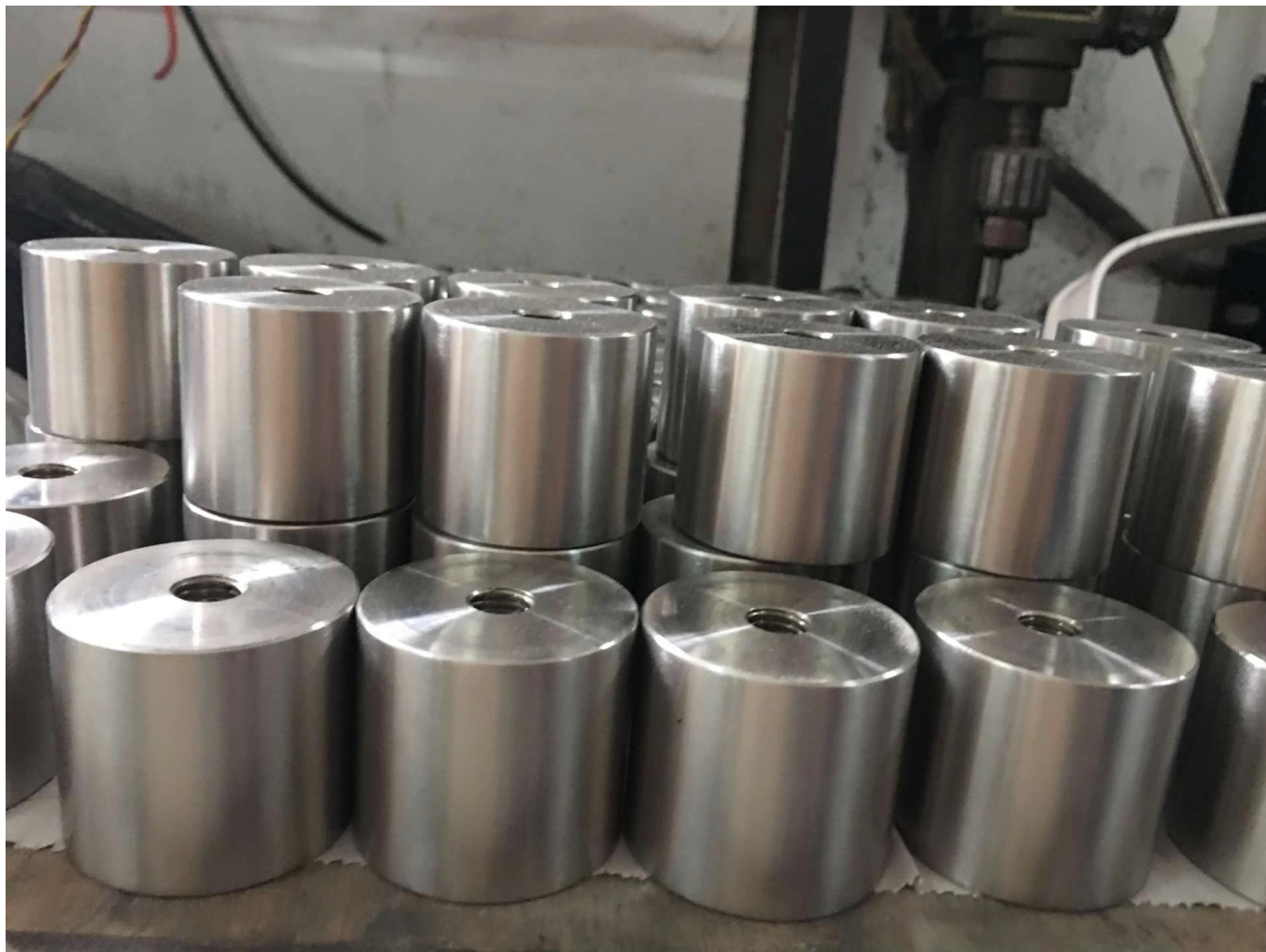
Projektuj zdjęcia bezramowych szklanych balustrad za pomocą naszych szklanych śrub dystansowych