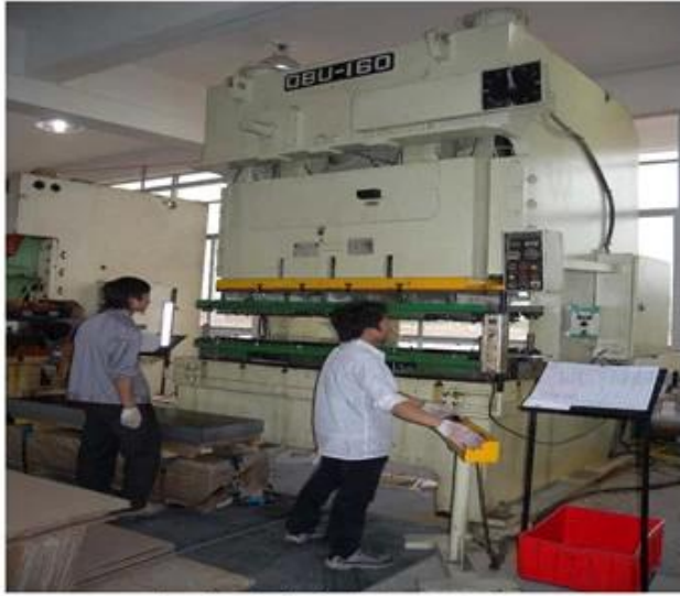
160T 宽台面冲床 模具加工尺寸800*1800mm