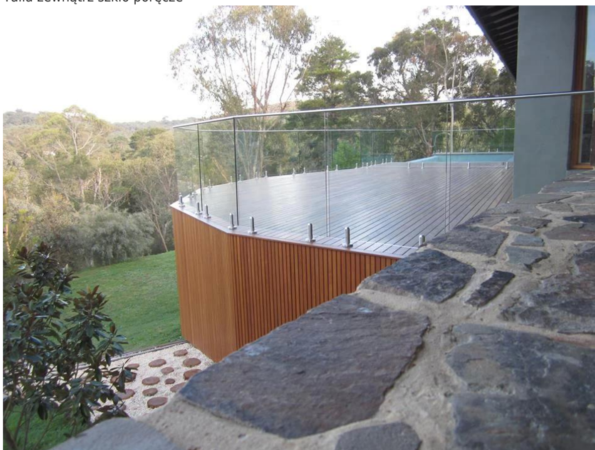
Kryty mini góry poręcz