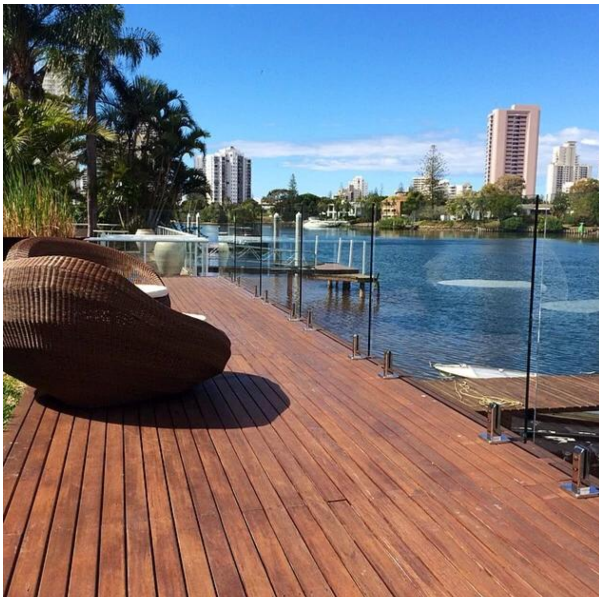
Zakrzywione szklane ogrodzenie z pokładu górnego poręczy: