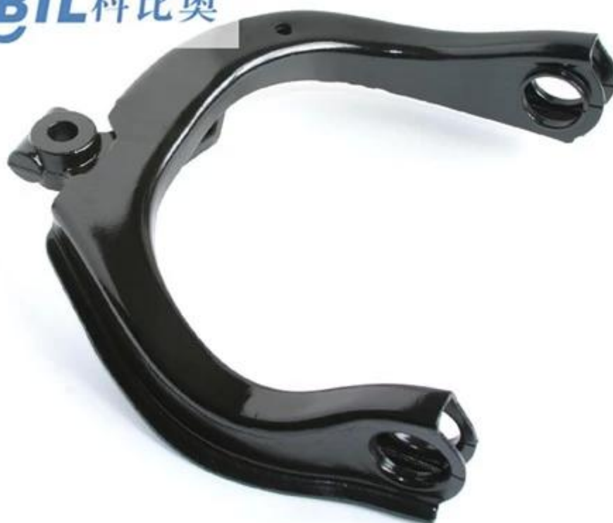
Prototyp Tłoczenie metali