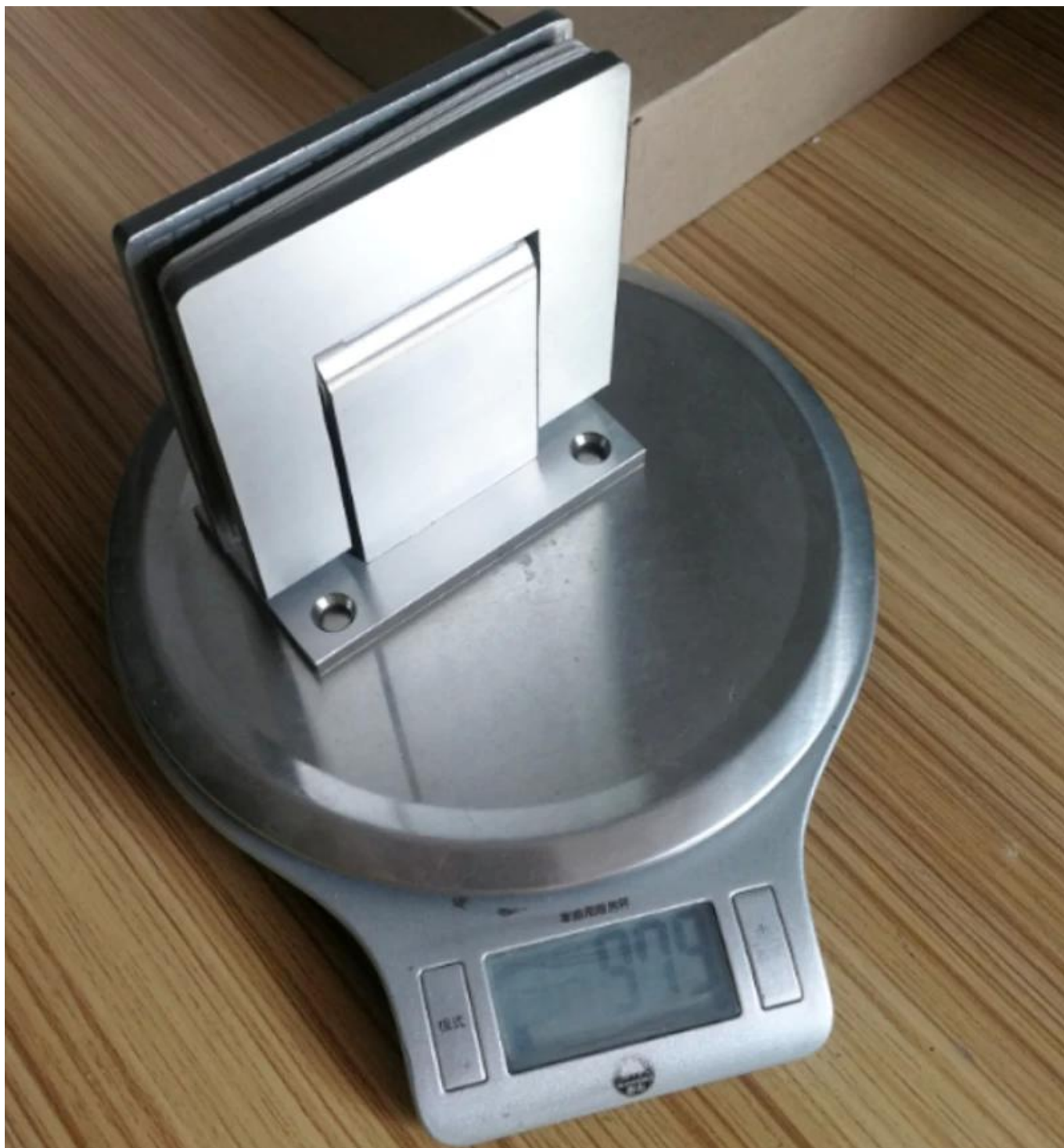
Zawias do drzwi szklanych 90 stopni i 180 stopni z materiałem ze stali nierdzewnej -