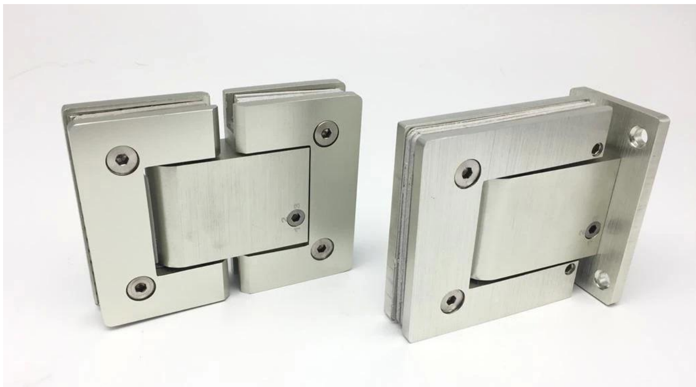
Zawias do szklanych drzwi 90 stopni (materiał ze stali nierdzewnej i aluminium) -