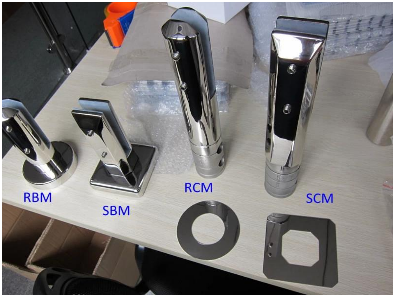
Zdjęcia projektów dla odniesienia: