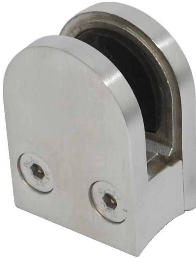
Płyta boczna retencji zacisk szkła szkło na stoku