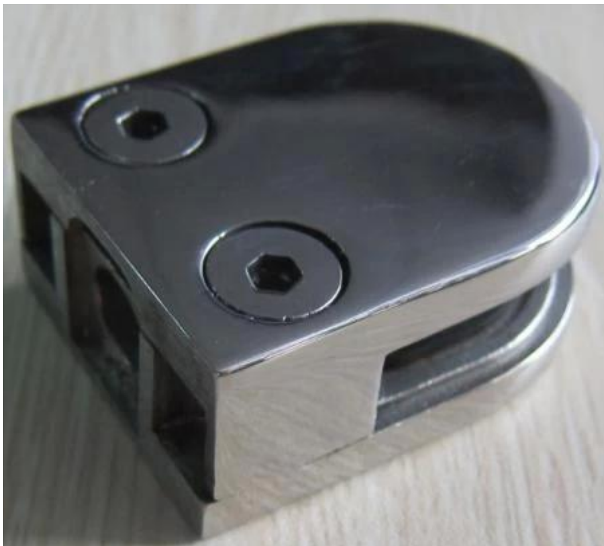
Promień z powrotem (na okrągłą postu)