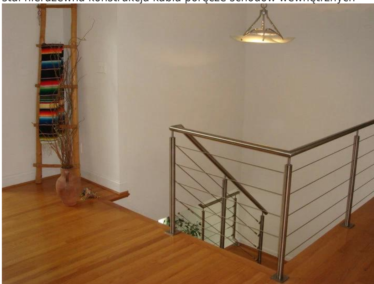
Roczne mocowanie. Stylistyka Przewód ze stali nierdzewnej balustrada na zewnątrz balkonu,