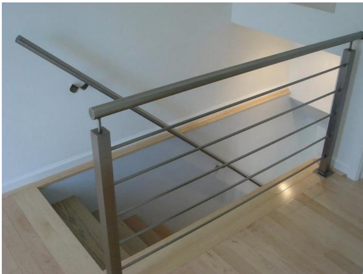
balustrady ze stali nierdzewnej System przewód, napięcie z gwintem wewnętrznym kabel, wewnątrz / na zewnątrz balkon i balustrada schodów