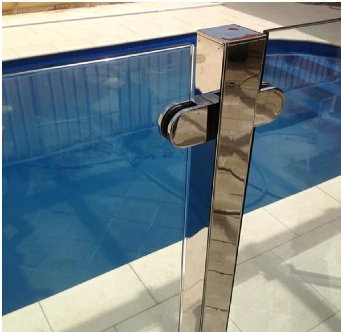
Podręcznik 5.installation do zacisku szkła