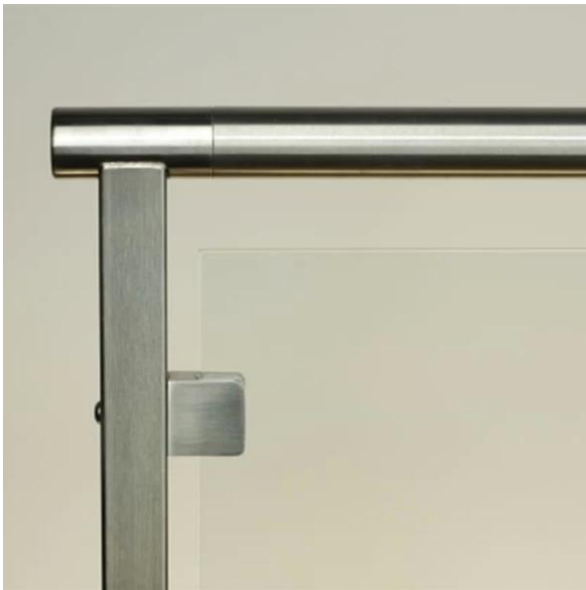
Czapka 4. koniec zaślepka ze stali nierdzewnej do poręczy okrągłej rury, poręcze ze stali nierdzewnej okrągły Zaślepka na po schodach