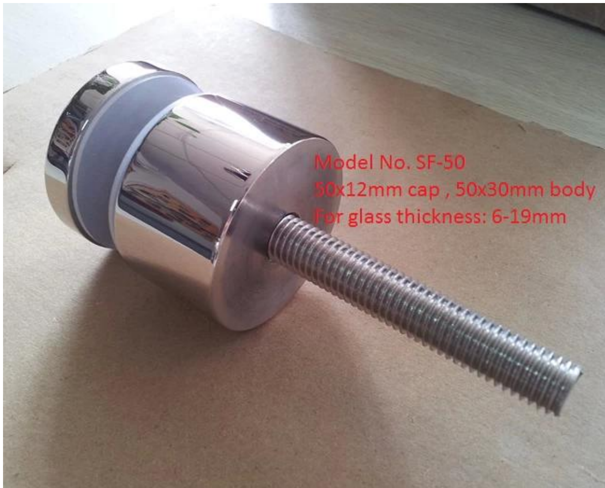
Model No.SF-50T Szkło patowa