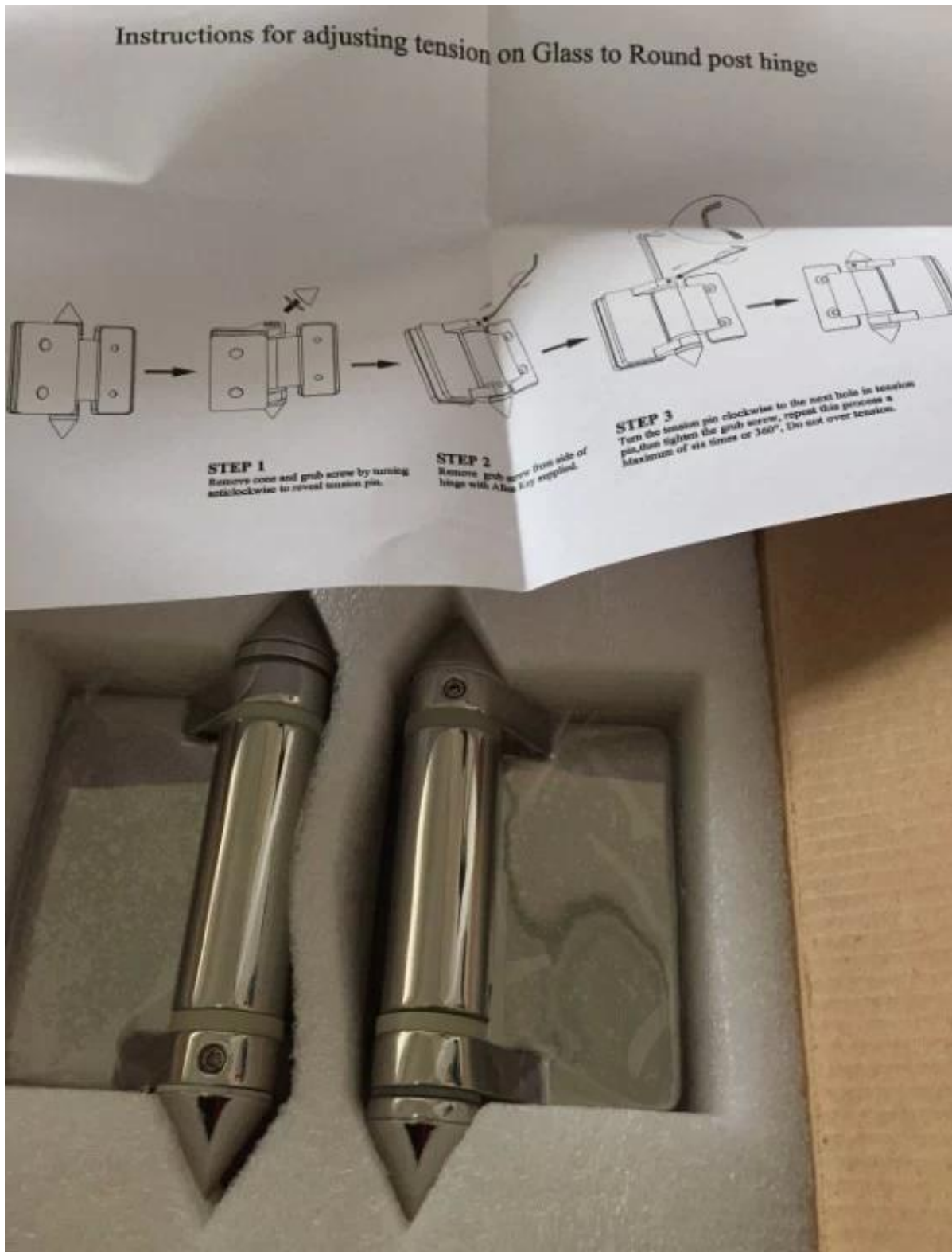
# Zdjęcia projektów ze szkła ze stali nierdzewnej do okrągłego zawiasu szklanego