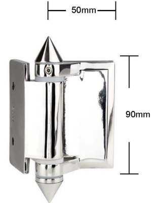
Part # G-W