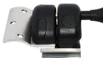
MODEL # GL-R

-Zdjęcia projektowe szklanego ogrodzenia pływającego z zawiasem, zatrząskiem, okuciami z czopami-