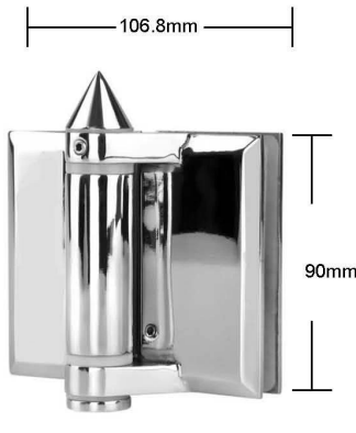
Part # G-G

Spring can be adjusted for closing speed control .