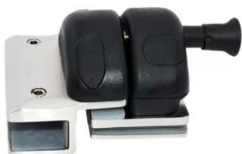
MODEL # GL-180

Zatrząsk ze stali nierdzewnej, kliknij zdjęcie poniżej, aby uzyskać więcej informacji-