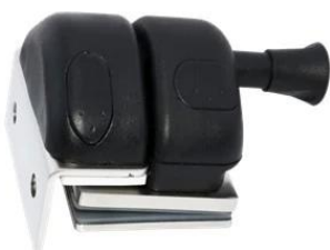
MODEL # GL-W