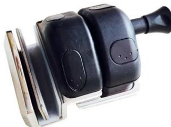
MODEL # GL-90