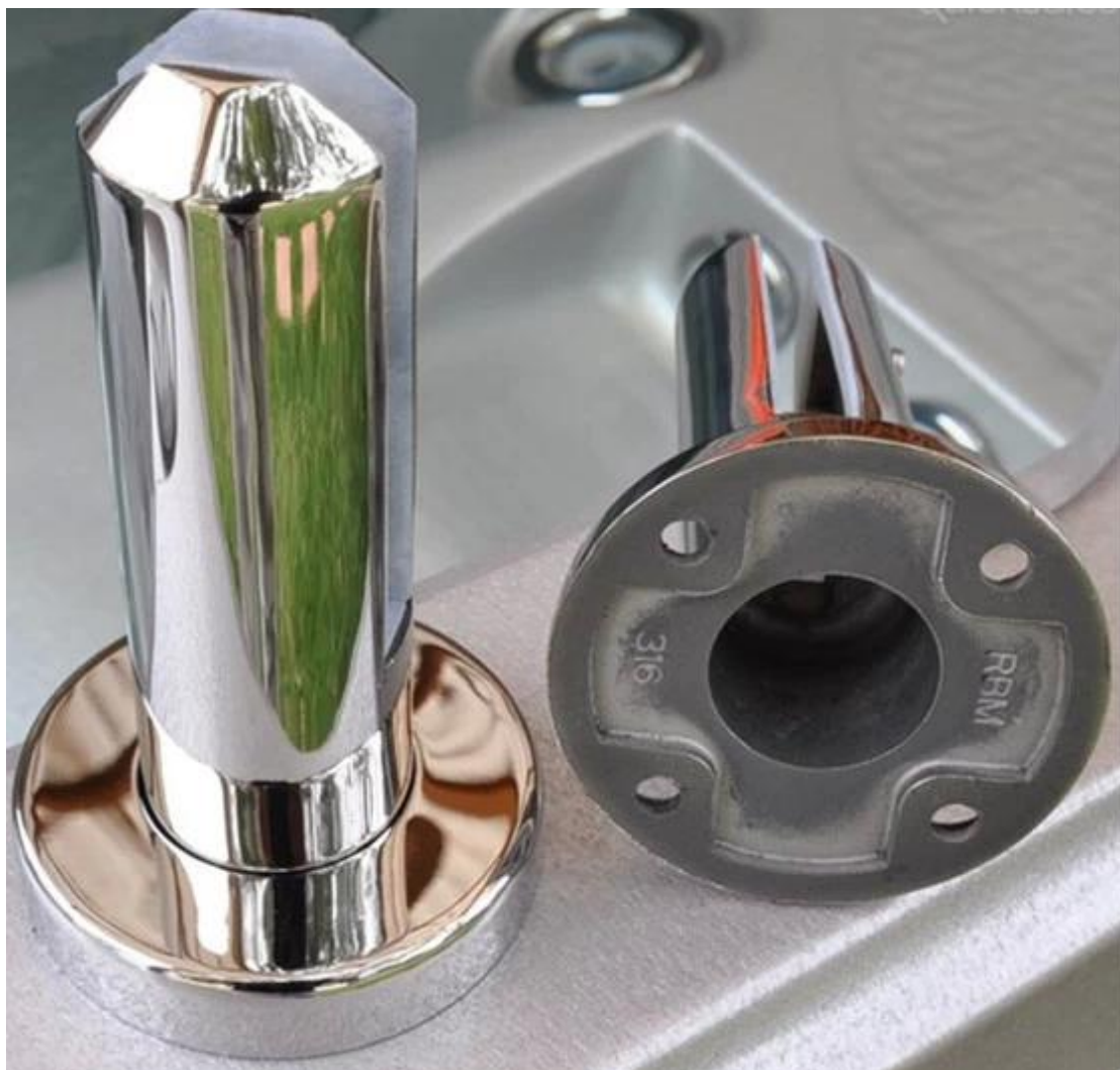
Szkło 12mm na basen ogrodzenia, hartowane szkło do szkła panel balustrady