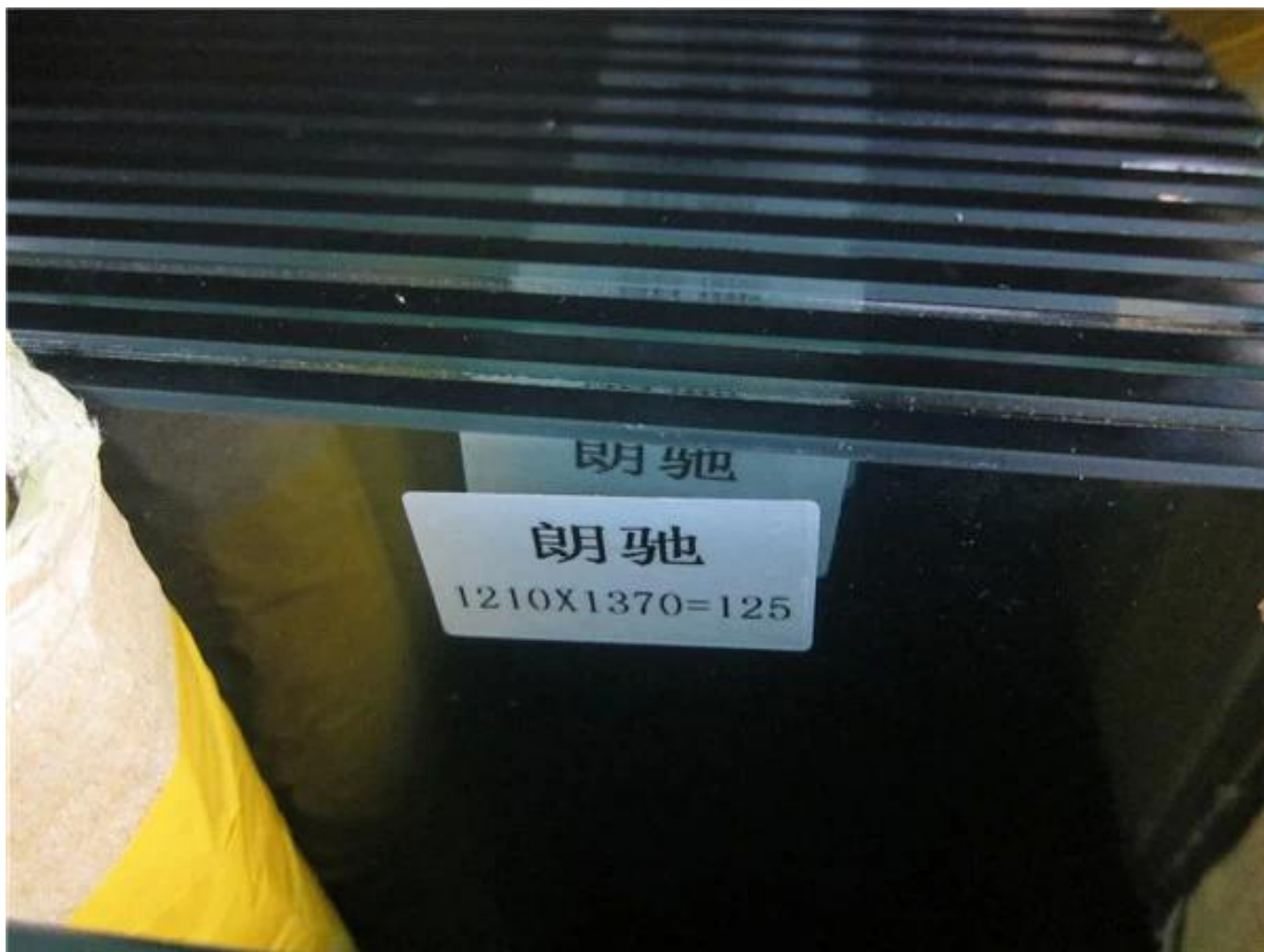
Ultra przezroczyste szkło