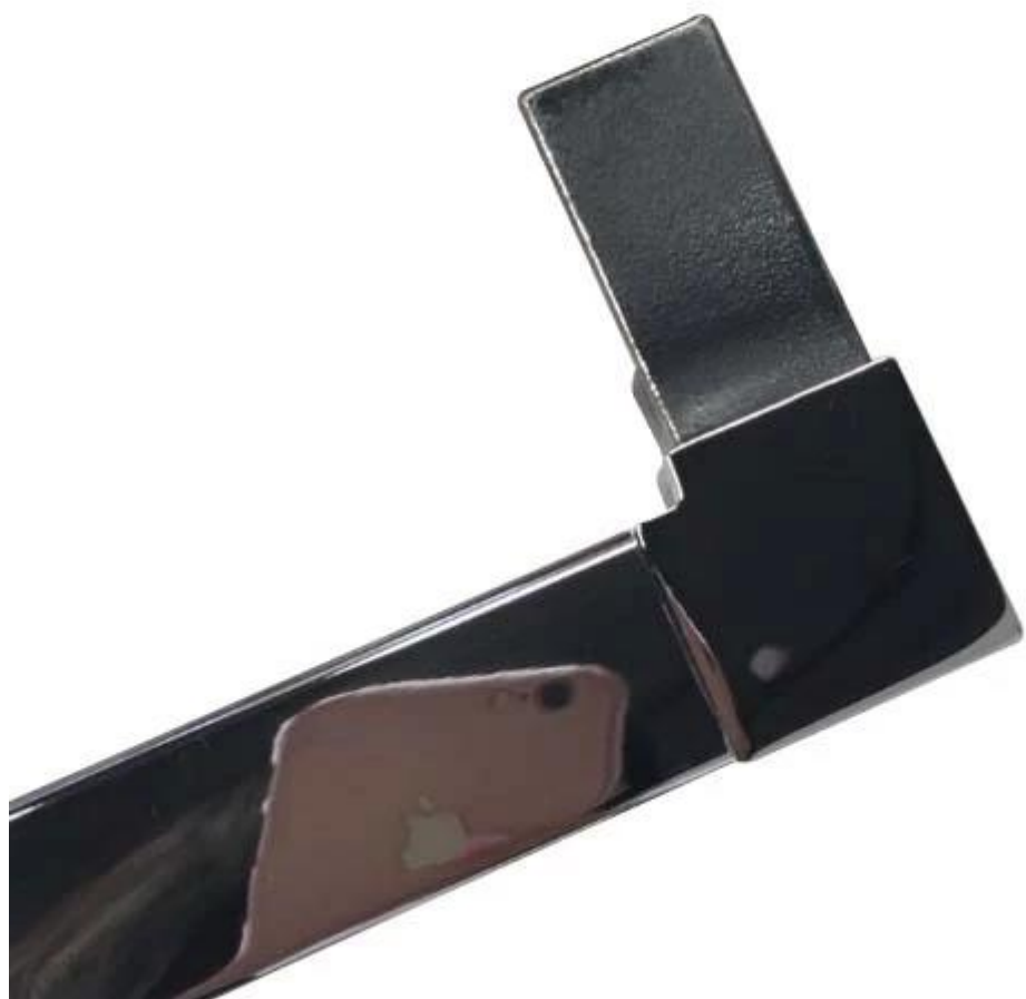
ściany do złącza szynowego