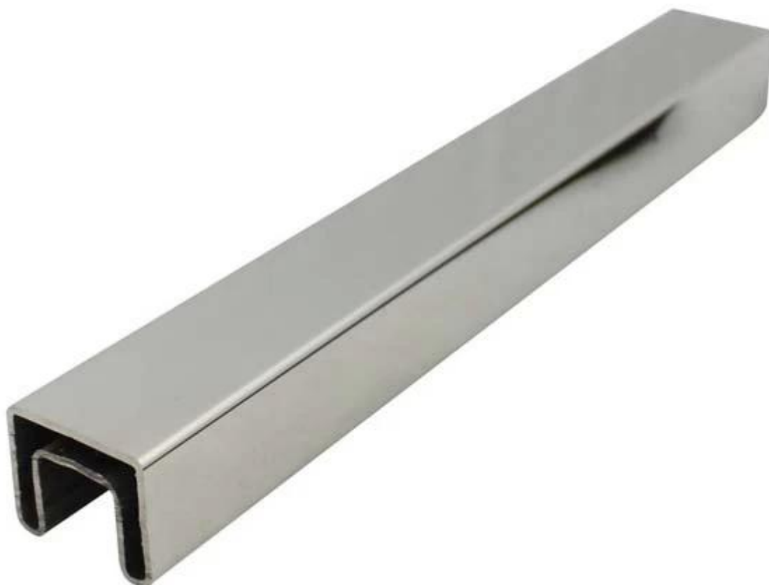
180 Złącze do rur kwadratowych stopnia gniazda