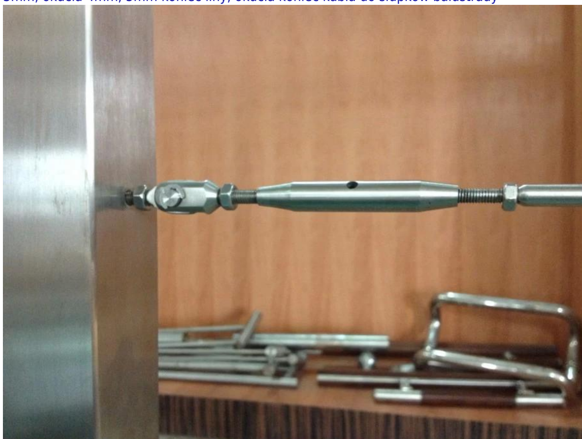
Drut ze stali nierdzewnej balustrada lina wewnątrz System do projektowania schodów, inox304 / 316 Kabel poręcz z tensora linowej na schody i balkon