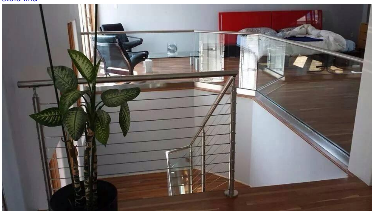
Chiny System bezpieczeństwa balustrada ze stali nierdzewnej na schodach na zewnątrz kabla, złączek kablowych ze stali nierdzewnej, stal nierdzewna liny poręczy