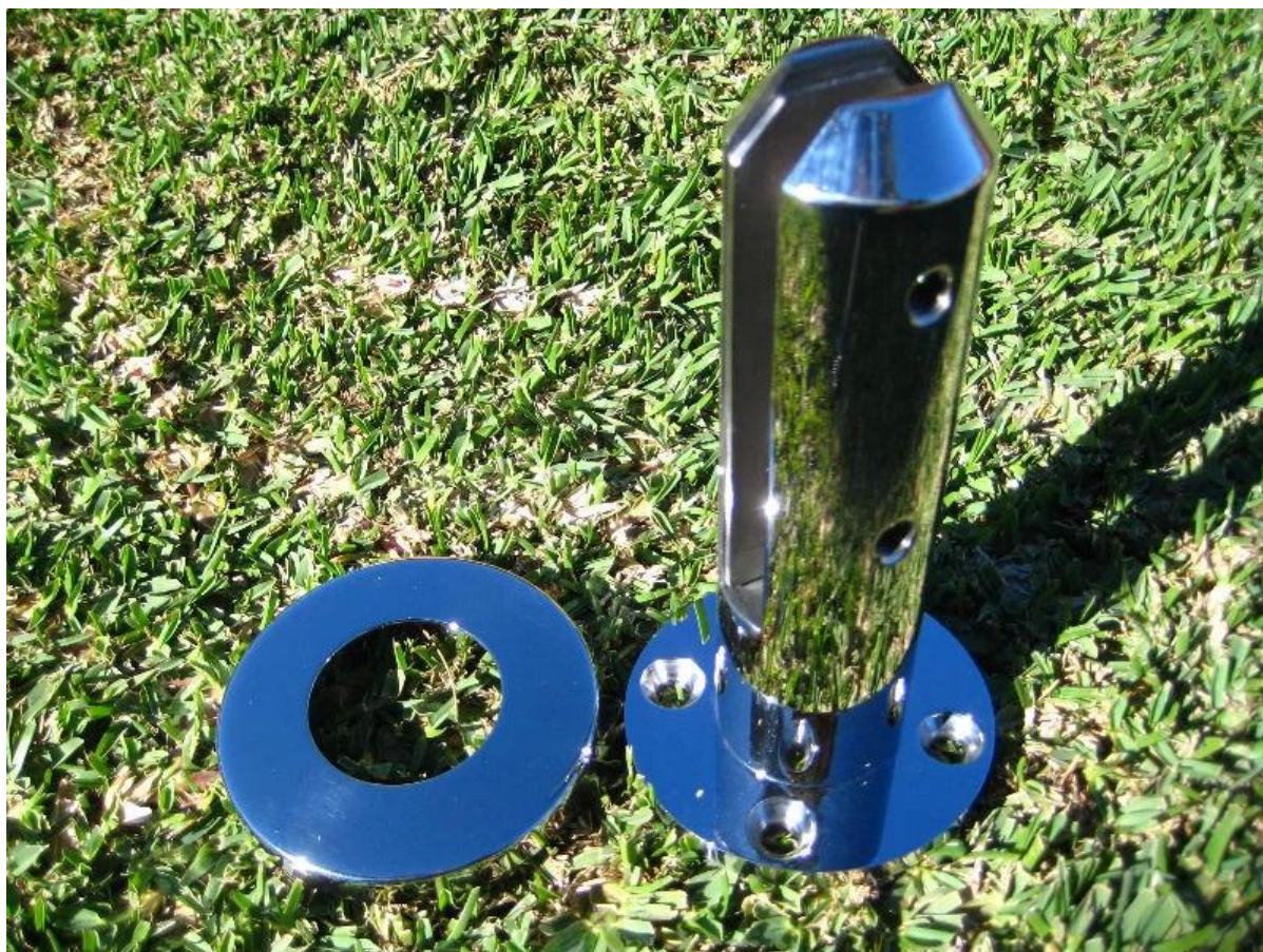
aço inoxidável da dobradiça 316 vidro da porta para cercas piscina, meia & quot; dobradiça da porta de vidro para balaustrada de vidro