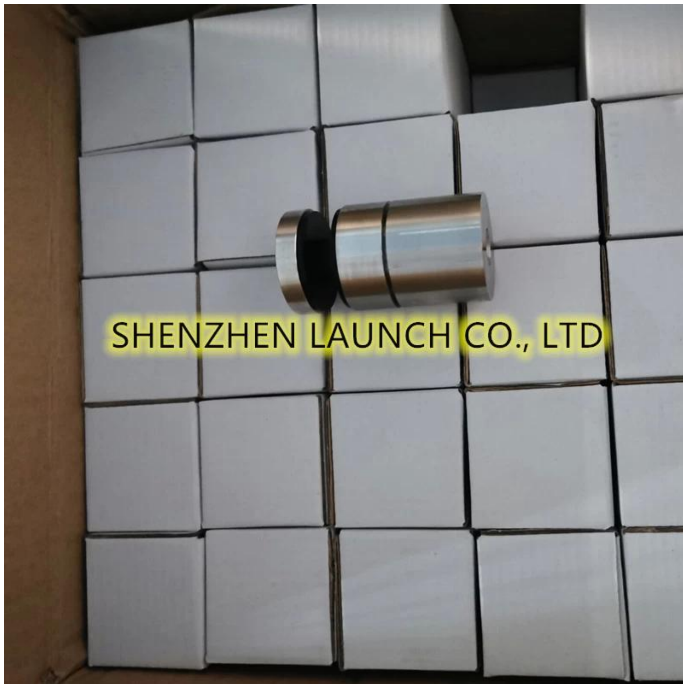
Outros tipos de parafusos de suporte de vidro disponíveis -