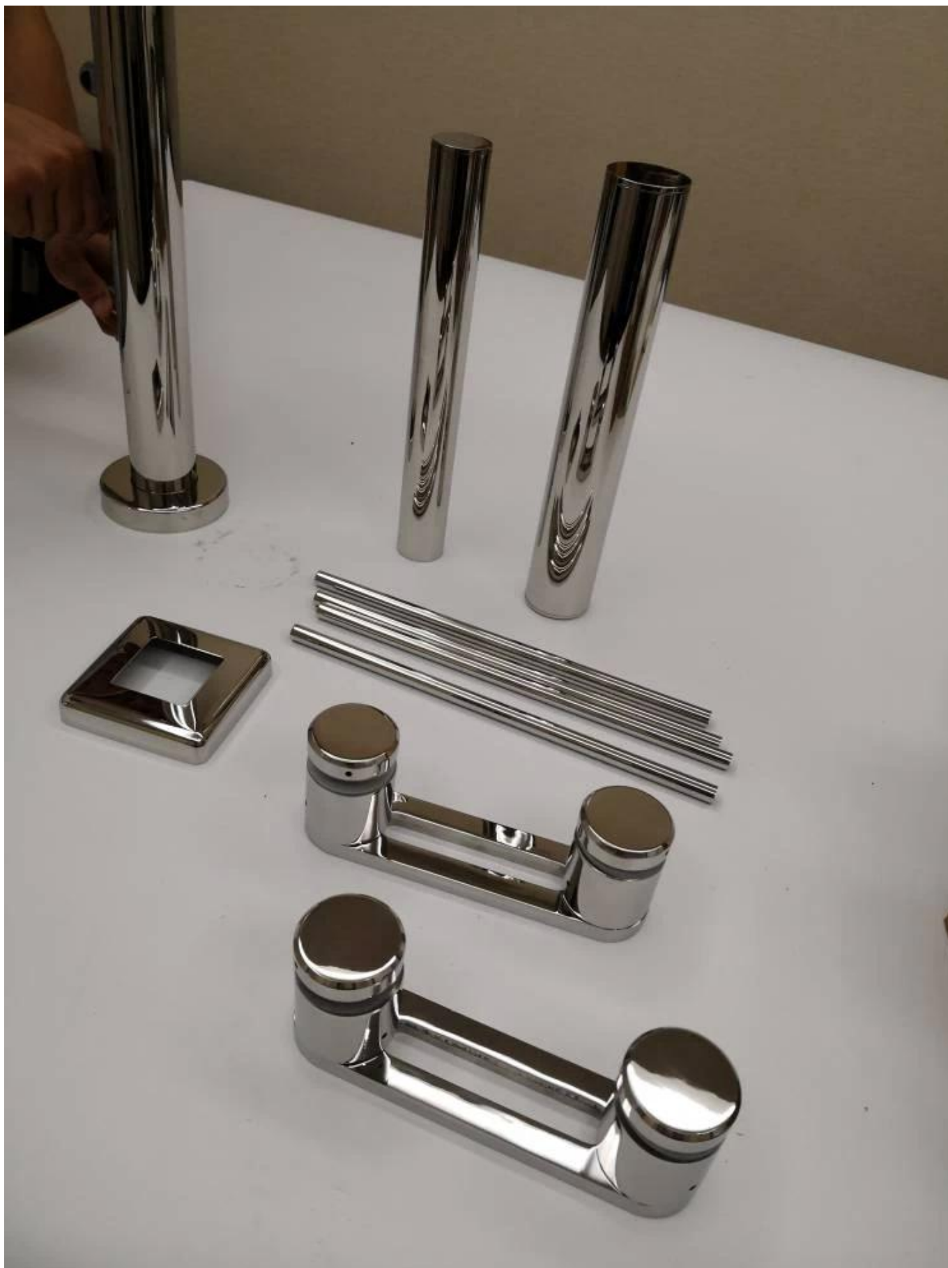
Fotos de produção para parafuso standoff-