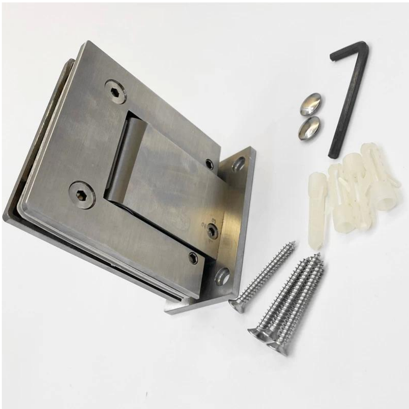
Dobradiça de 280 graus de vidro B180