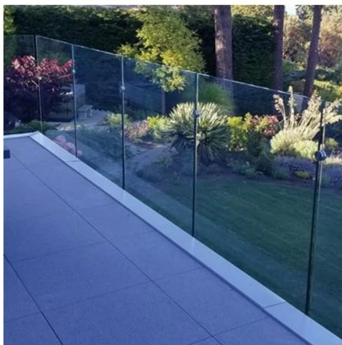
Outros modelos de espaçadores de vidro como abaixo