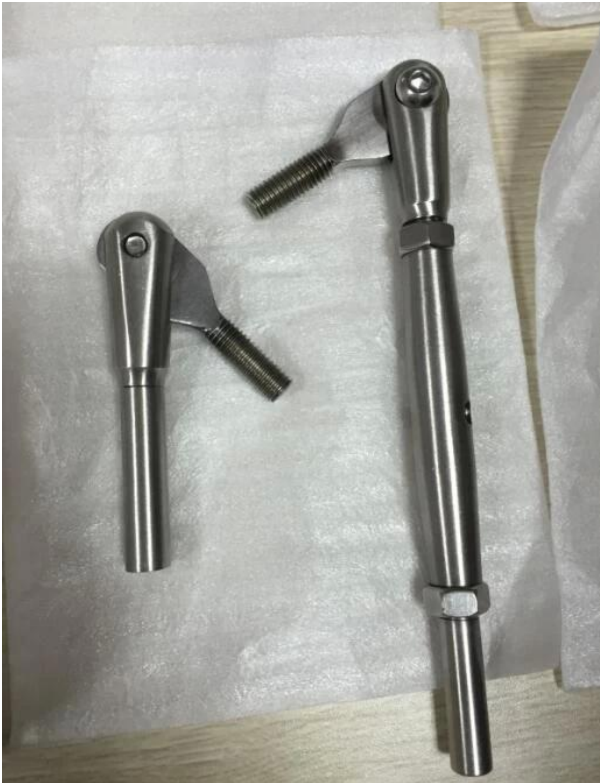
2) Dimensão T804 do tensor do cabo