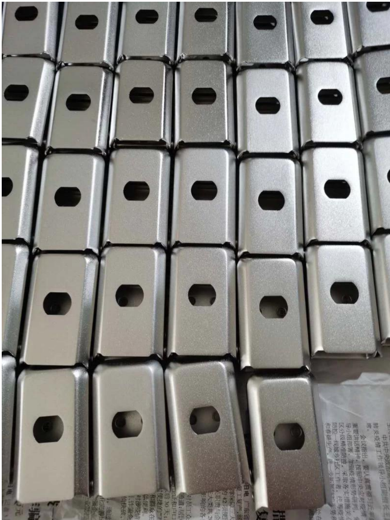
Outros produtos OEM