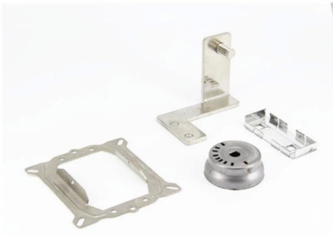
Produtos de estampagem de chapa metálica