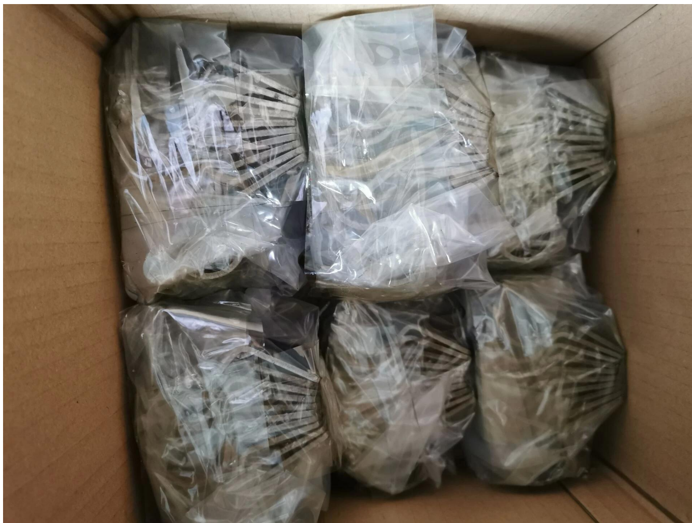
Produtos de estampagem de chapa metálica