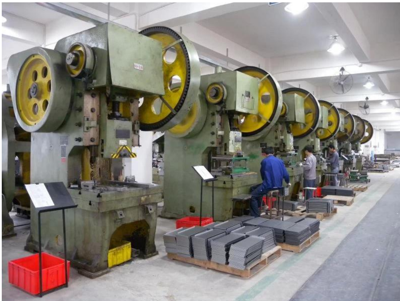
Máquina de dobra