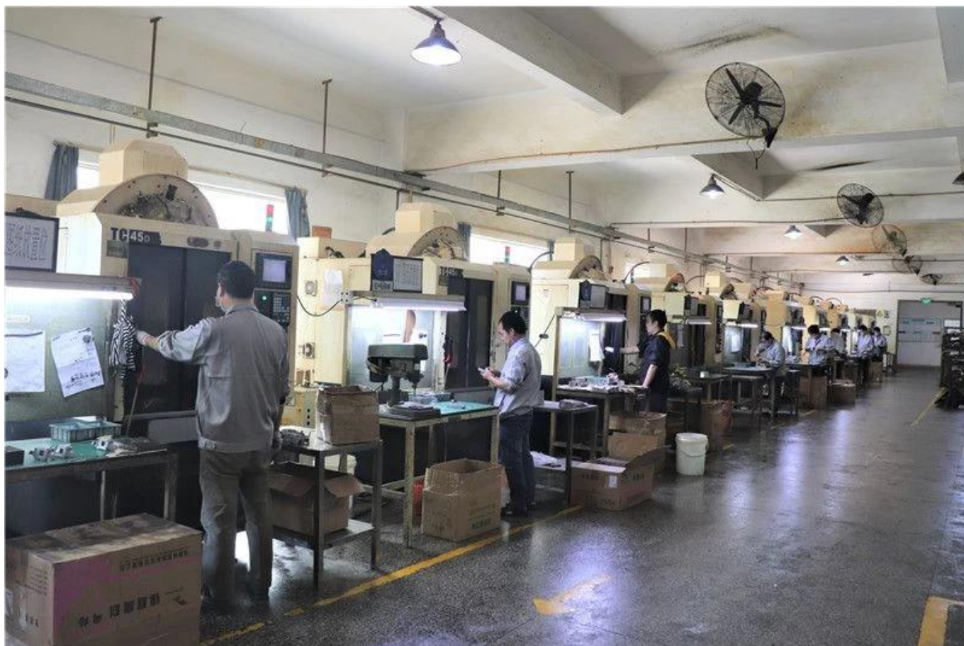
Máquina de estampagem