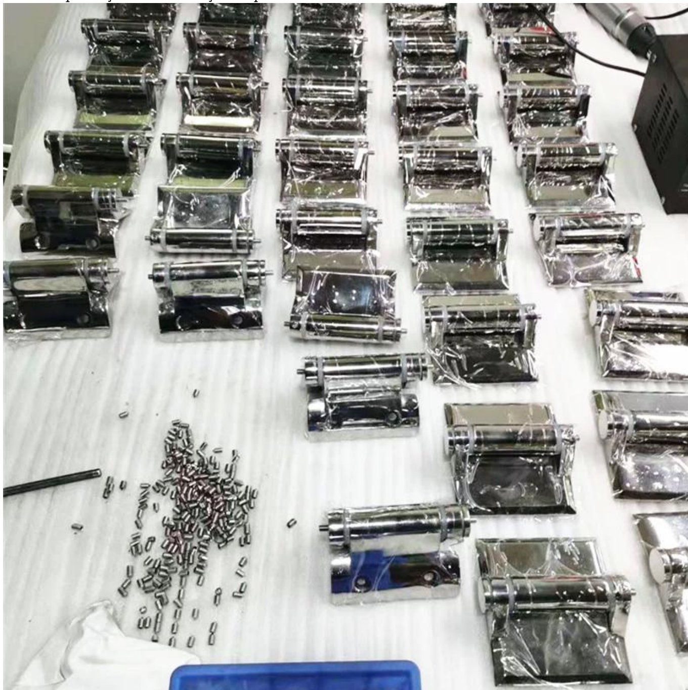
Fotos do projeto da cerca da piscina