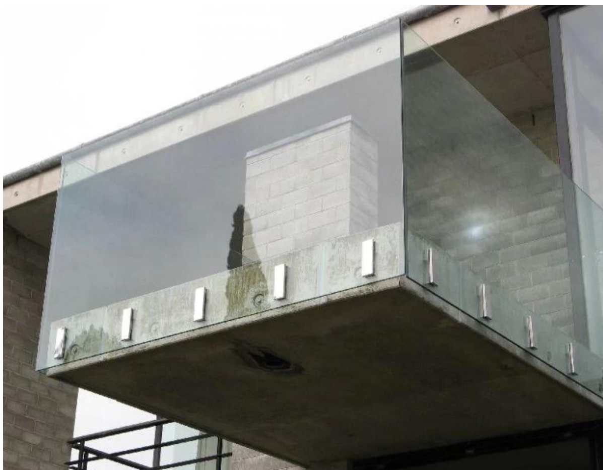
Braçadeira de vidro do spigot do windscreen frameless da montagem da