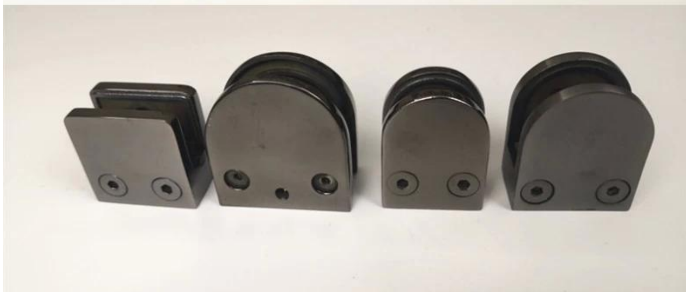
Diferentes tipos de braçadeiras de vidro com dimensões: