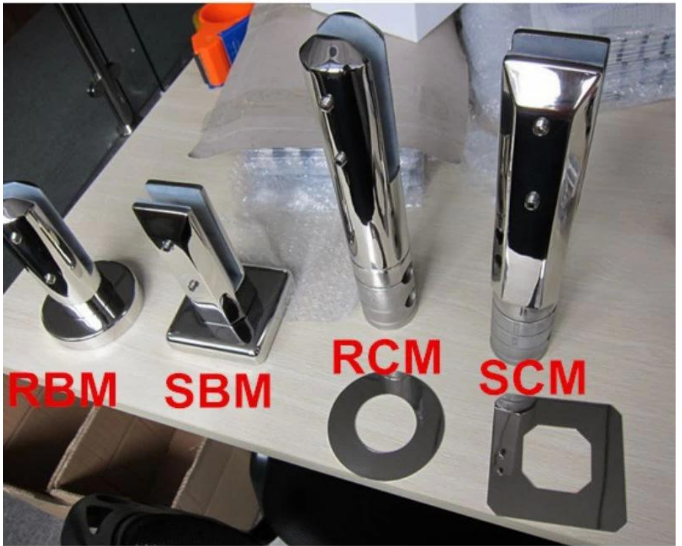
Acabamento de superfície acetinado