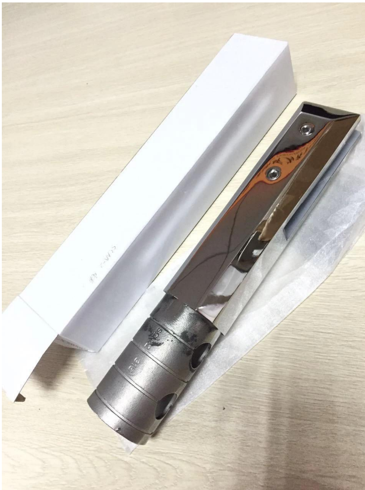
RCM 50 milímetros rodada forma diâmetro; Cetim escovado, superfície elegante;