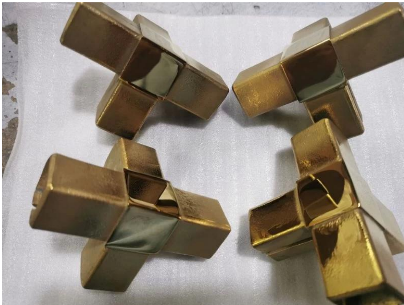
Tampa da extremidade do tubo para o tubo 25 × 25 × 1.5mm