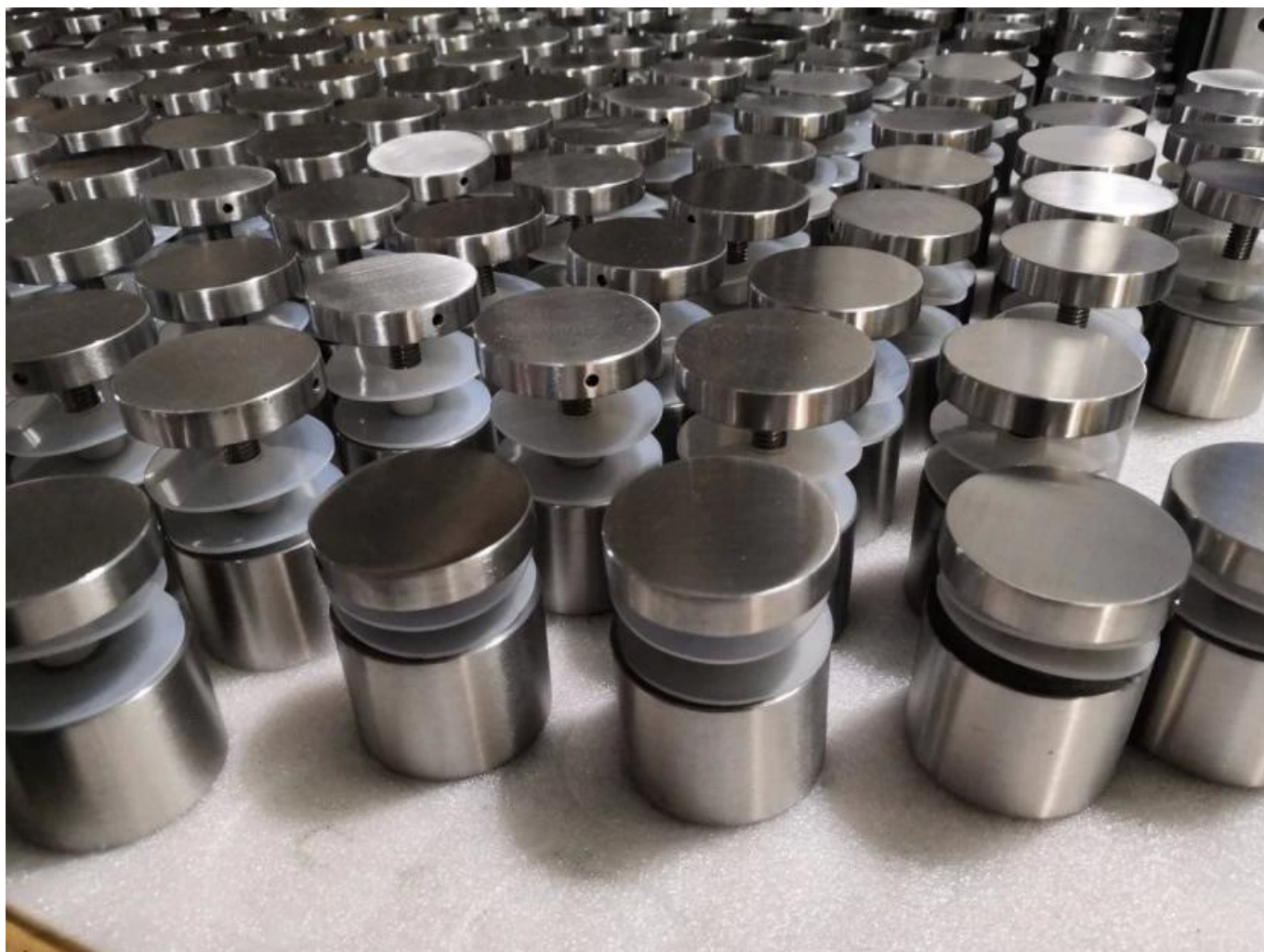
Fotos de instalação de railings de destilação de vidro