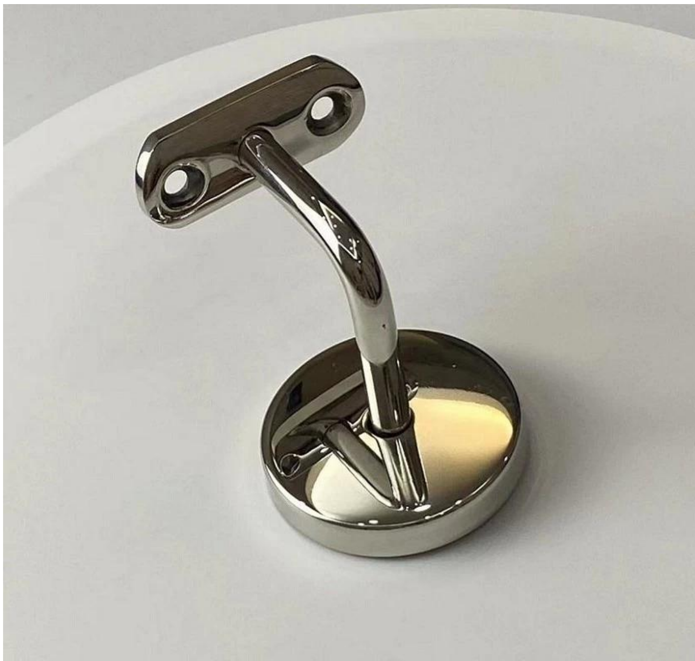
Com Plano Placa para Quadrado Corrimãos: